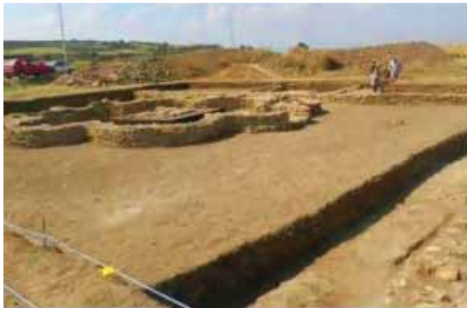
Vendi ku behën gërmimet dhe sistemohen objektet