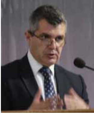
Romeo Gurakuqi Instituti i Historisë Bashkëkohore Universiteti European i Tiranës

Republika e dytë parlamentare shqiptare e tranzicionit është në një krizë të rëndë. Tatëpjeten e Republikës, në pik-pamje të ruajtjes së parametrave të të qenurit Shtet, mund ta shpëtojë frenimi i rënies së matutjeshme, përmes reformimit të institucioneve kushtetuese dhe skemës institucionale.