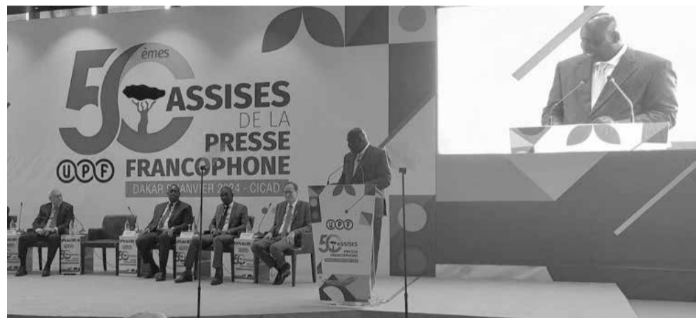
Presidenti Ndërkombëtar i UPF, duke folur në Kongres

PRESIDENTI I UPF DIAGNE, NJERIU I VITIT 2023 NE SENEGAL