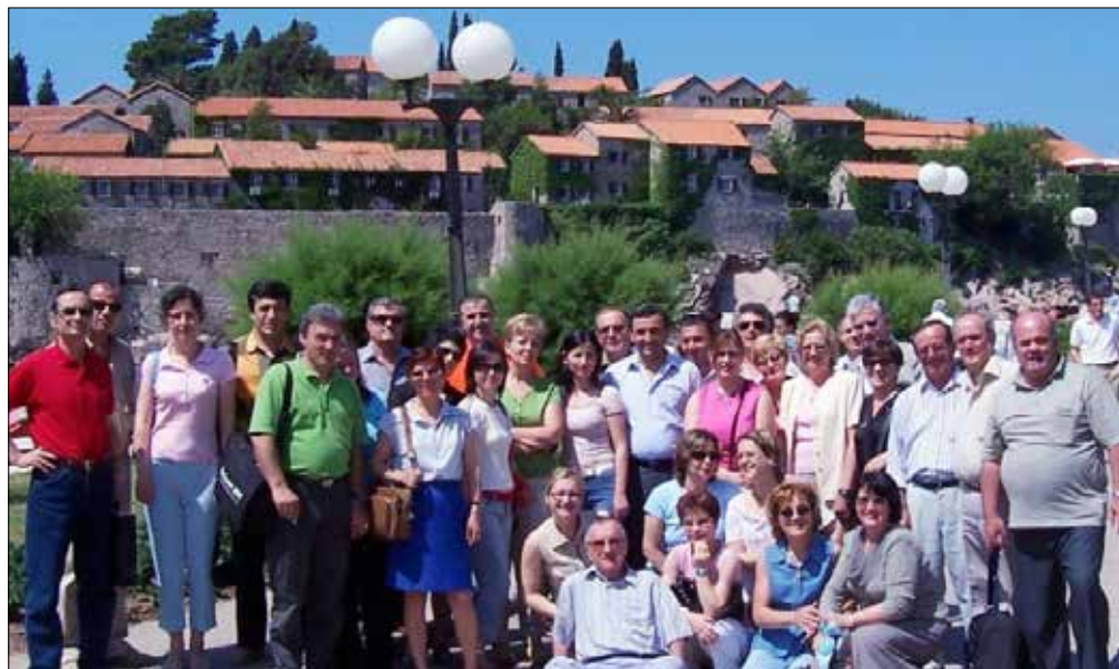
Grupi i Shërbimit të Psikiatrisë, Budva, Maqedoni, 4 qershor 2005

Pas viteve 1990, me krijimin e mundësive më të mëdha për studime e kualifikime jashtë shtetit, kryen një specializim në Qendrën Akademike të Amsterdemit (Programi TEMPUS), më pas edhe disa të tjera afatshkurtra në Missouri (SHBA), në Birmingham (Angli), në Vienë, në Bullgari e të tjera. Ai mori pjesë në mbi 45 kongrese dhe konferenca ndërkombëtare, duke referuar në 15 prej tyre. Si rezultat i vlerësimit të veprimtarisë së tij të gjerë shkencore dhe profesionale, në vitin 2004, i jepet titulli "Profesor i Asociuar", një arritje mjaft e rrallë për kohën në fushën e psikiatrisë në Shqipëri.