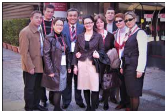
Në një veprimtari ndërkombëtare, në Firenze- Itali, 3 prill 2009

Krahas përgatitjes për arritjen e një niveli të lartë profesional dhe për perfeksionim të mësimdhënies, u mor edhe me studime shkencore, duke qëndruar vazhdimisht në kontakt me të rejtat e literaturës së fushës së psikiatrisë. Rezultat i rëndë-