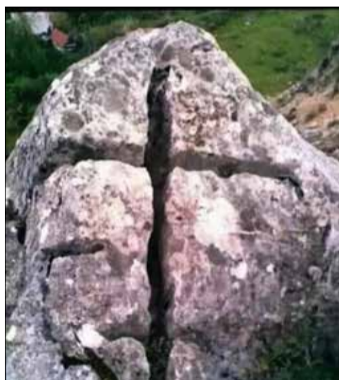
Guri me kryq natyral, në fshatin Gimaj