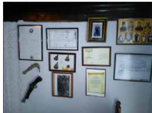
Mini muzeu i familjes

Gjatë luftës qëndroi më tepër afër familjes në Shkodër, përveç në periudha të shkurtra mujore kur shërben si Nën-prefekt në Delvinë dhe Lushnjë, e në