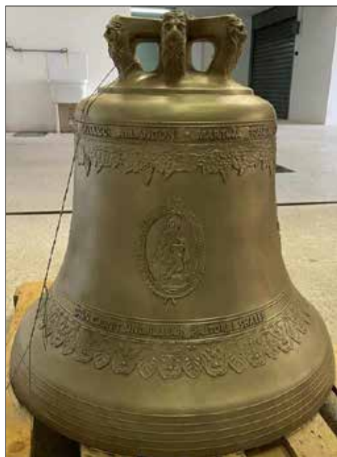
Kambana e kishës së Shën Rrokut, në fshatin Gimaj