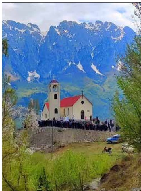
Kisha e Shën Rrokut, në fshatin Gimaj