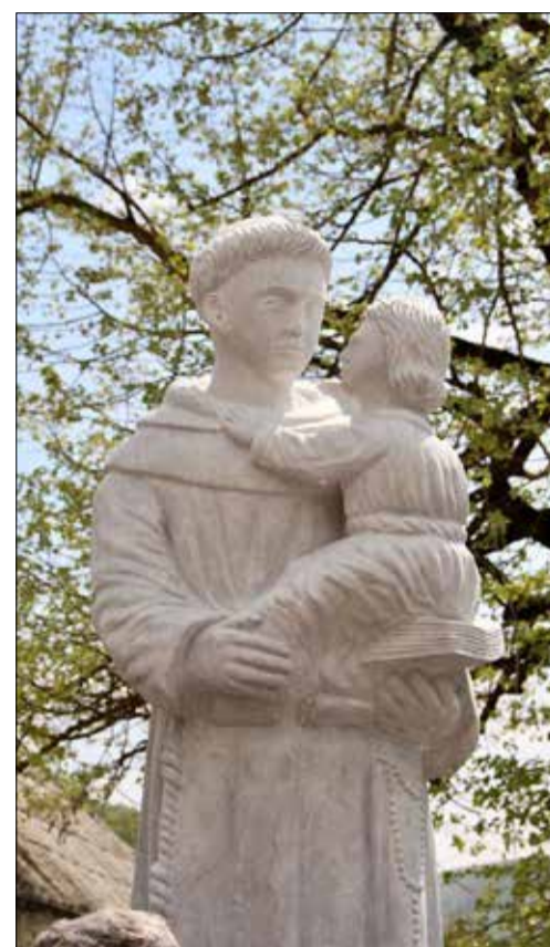
Truporja e Shna Ndout

Mirë që keni pasaportën Amerikane, sepse do ti kishe djegur dokumentet. Si-