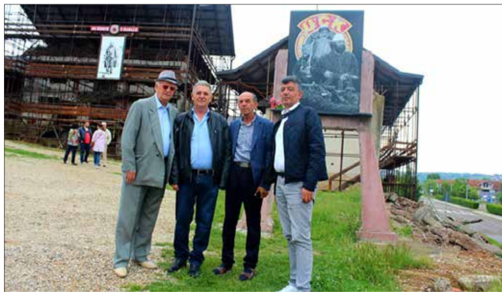
Pamje nga shtëpia e Jasharjave