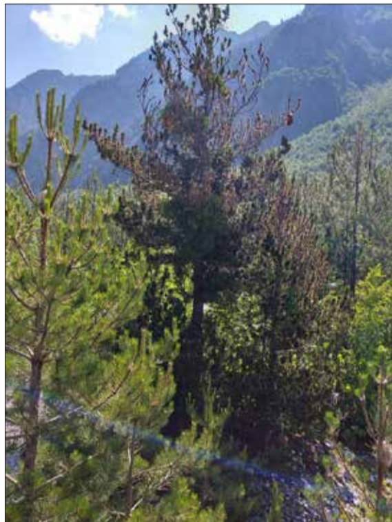
Në fshatin Nderlysa

tregojnë se procesionarja ka aftësi shumë të jashtëzakonshme, pasi flutura mund të zhvendoset në një hapësirë 10 deri në 15 kilometra. As gjë nuk është bërë, ndërkohë lufta duhet të jetë e vazhdueshme për të shpëtuar pyjet. Edhe një brigadë e vogël me shkalla e mjete të thjeshta me anë të djegies brenda kësaj verë do ta nxirret pishën