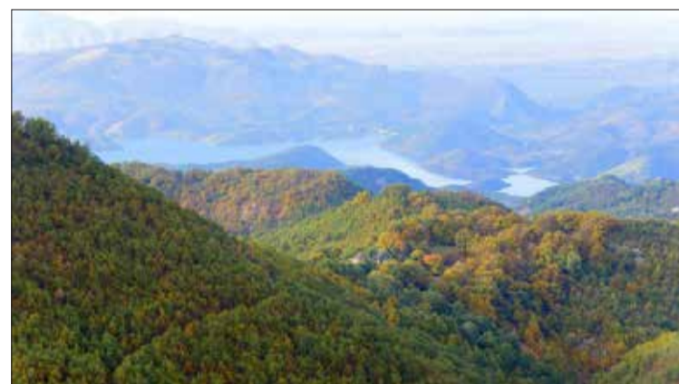
Pamje të përgjithshme të Shllakut