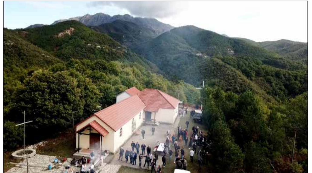
Kisha e Shën Prendes, në mes fshatit Ukbibaj e Vukaj