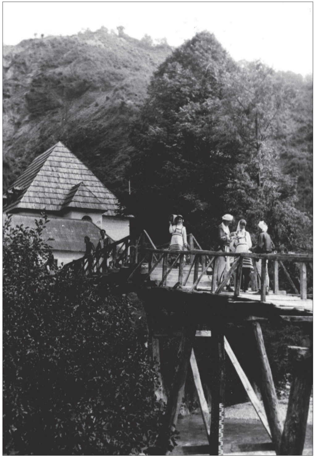
Në Urën e Shalës në vitet '80