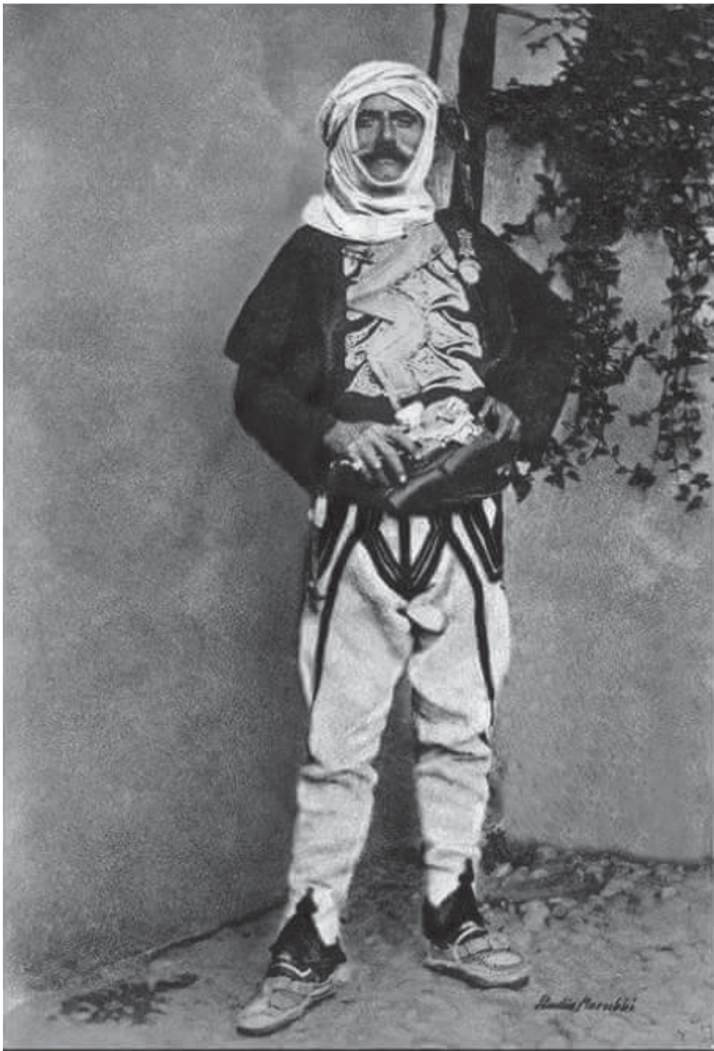
Souvenir d'Albanie - Mar Lula i Shalës