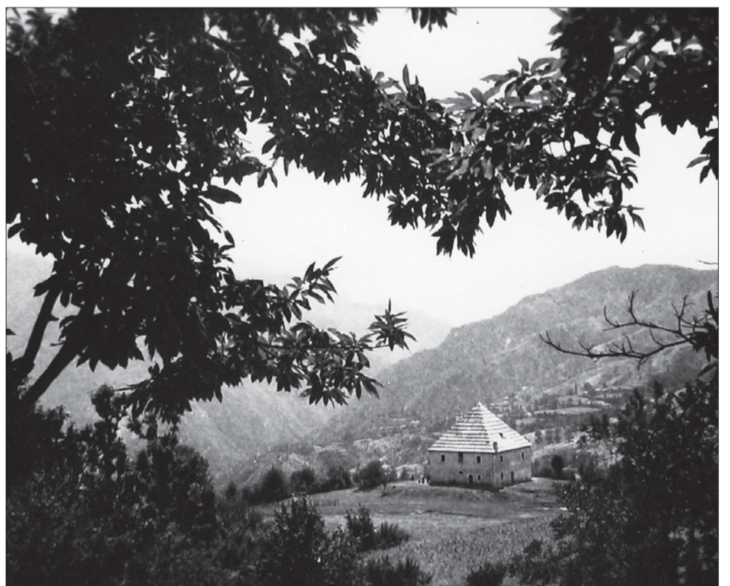
Kisha në Khan, 1938