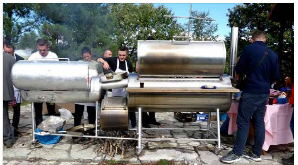
Zgare e madhe me pjekë mish