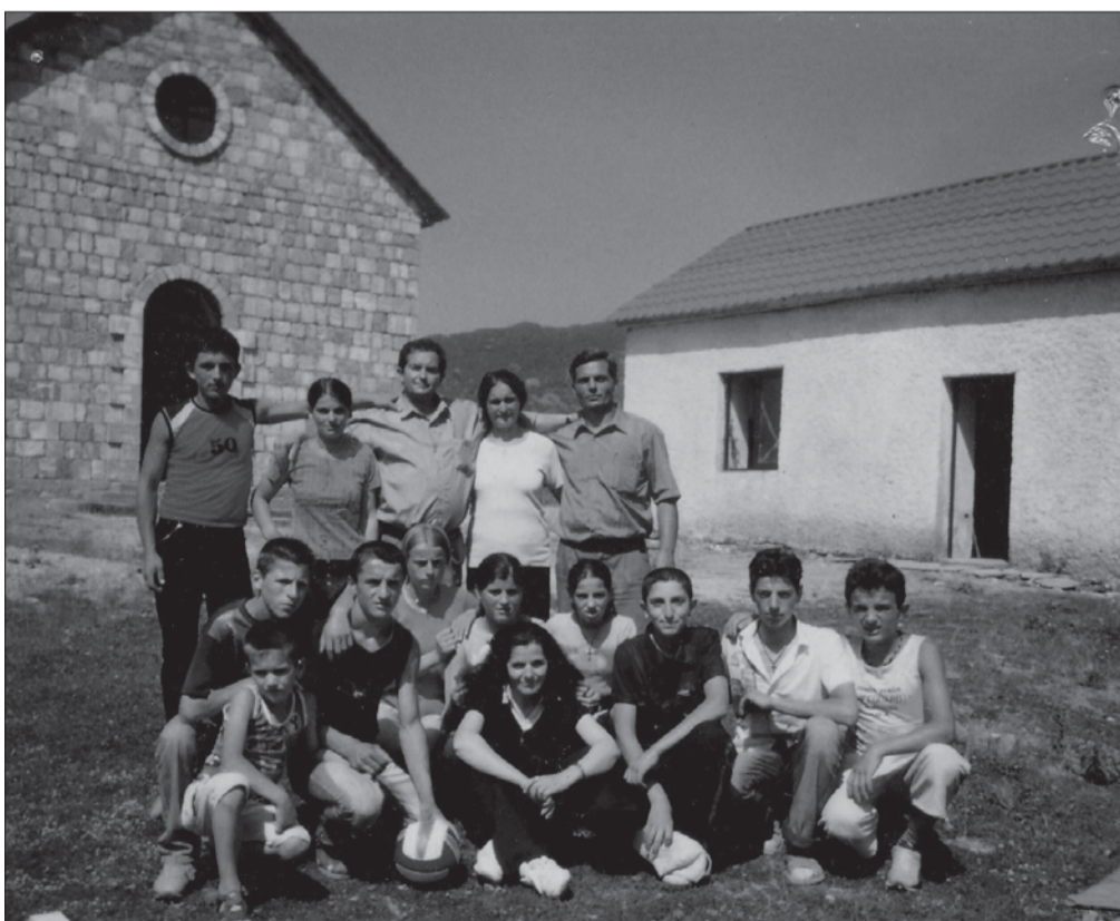
Nxënës dhe mesues të shkollës Palaj-Shosh, 2008