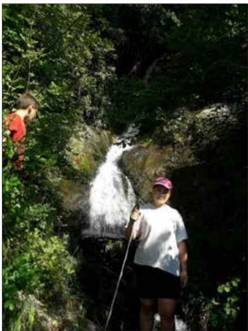
Ujëvara e Thanit