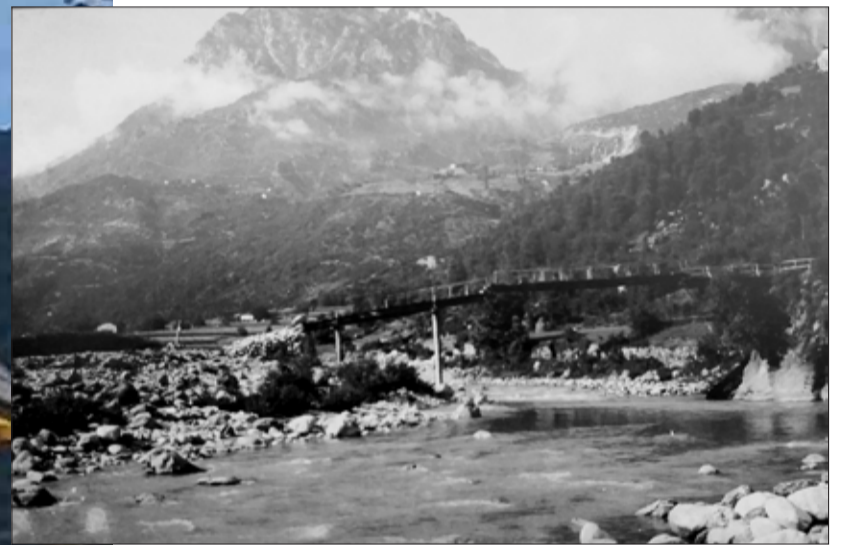
Ura e Shalës, 1938.