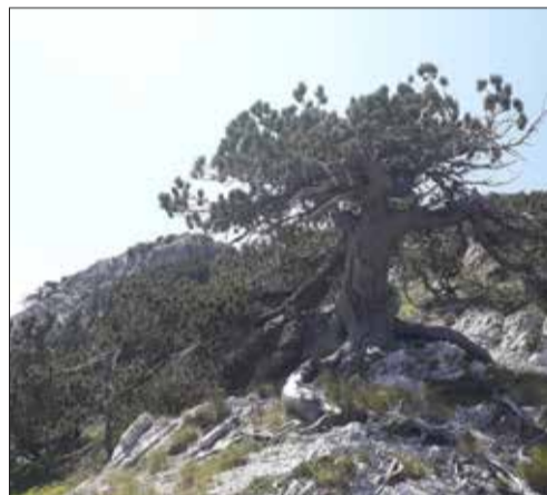
Çetina e Alpeve