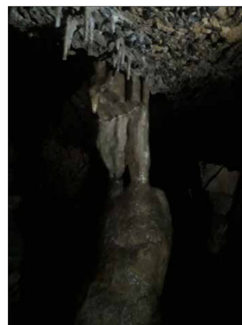
Shpella e Thanit

shpejt banorët e këtij fshati do të rikthehen të paktën për sezonin verorë dhe kjo do ta gjallëroj jetën përsëri.