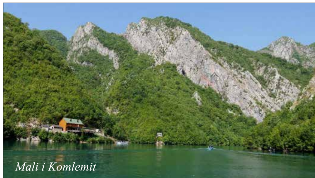
Mali i Komlemit