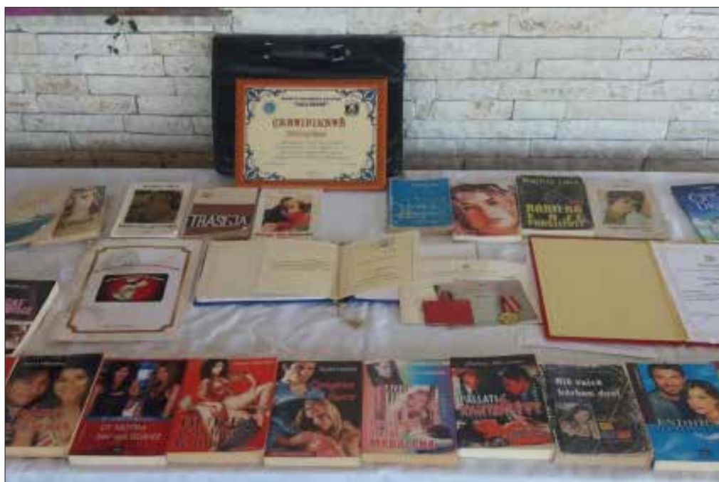
Disa nga botimet e Ramiz Likës