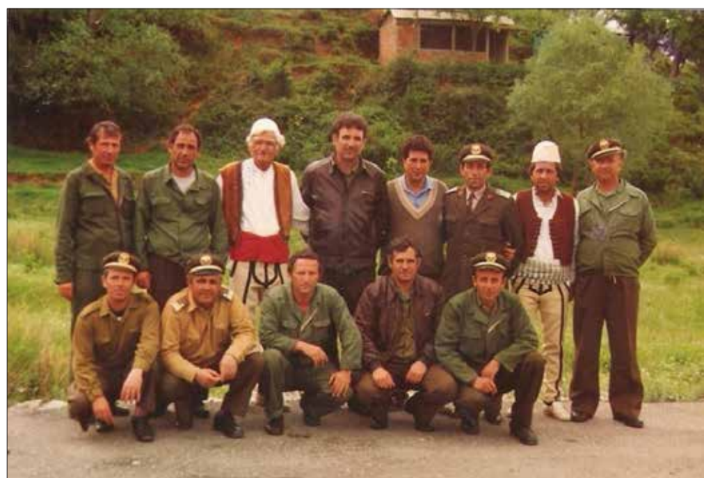
Shumë filma dhe dokumentare u realizuan me ndihmën e efektivit të aviacionit, me helikopter. Një nder këto është edhe filmi "Gjuetia e Fundit"