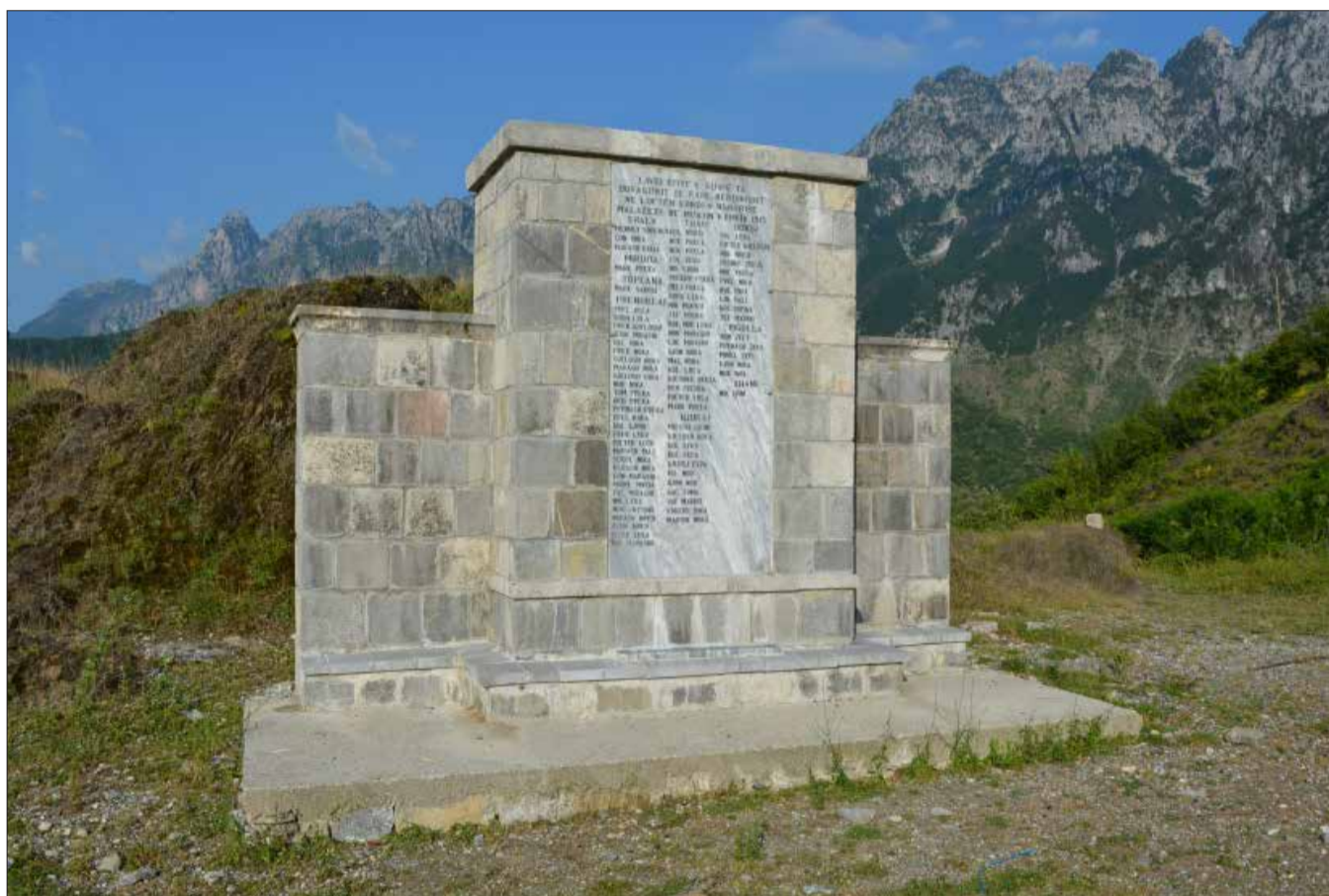
Lapidari i të rënëve në ngjarjen e muajit korrik 1915, 2019, Në vitin 1970, me rastin e 55 vjetorit të gjakut të tyre, Rushi, në Qeresh u ndërtua Lapidari, i cili u rindërtua në muajin korrik 2015, me rastin e 100 vjetorit të kësaj Qëndresë, nga Shoqata “Atdhetare-Dukagjini”

Forcat ushtarake malazeze, me gjithë përparimin dhe shumicën në