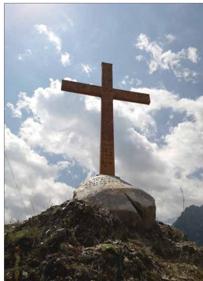
Kryqi i ndërtuar në vitin nga familja Pjeter nga fshati Plan

rrugëkalimin: Postopojë-Rrjoll-qafa e Beshkasit-Plan-Shalë, me detyrë: të çarmatoste banoret e zonës, të nënshtronte nga ana psikologjike dukagjinasit me prezencën ushtarake, dhe po të ngrinin krye t'i goditnin menjëherë dhe fuqishëm.