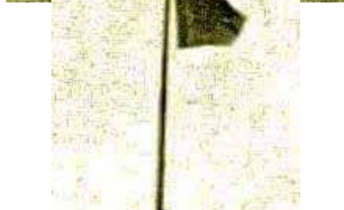
▲ Fotografi e nxjerrë nga Arkivi privat i Kolonelit Thompson, 1912. Flamuri i nxjerrë nga ne me shtizë e litar dhe me një pjesë të gjurmës së ish flamurit, i cili krahasohet me materialet e bot. nga Ekspozita e 25 vjetorit të Pavarësisë, 1937