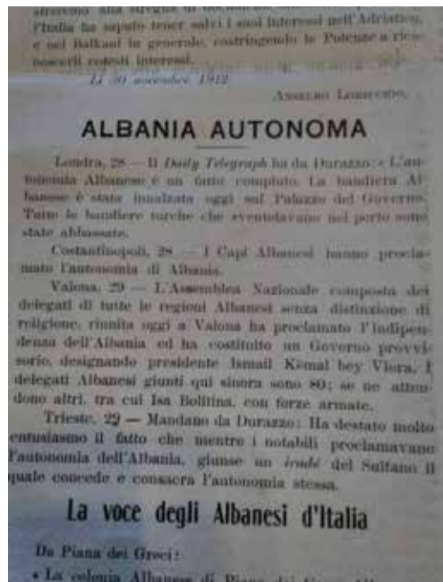
▲ Lajmi mbi autonomi pavarësinë në shtypin italian!