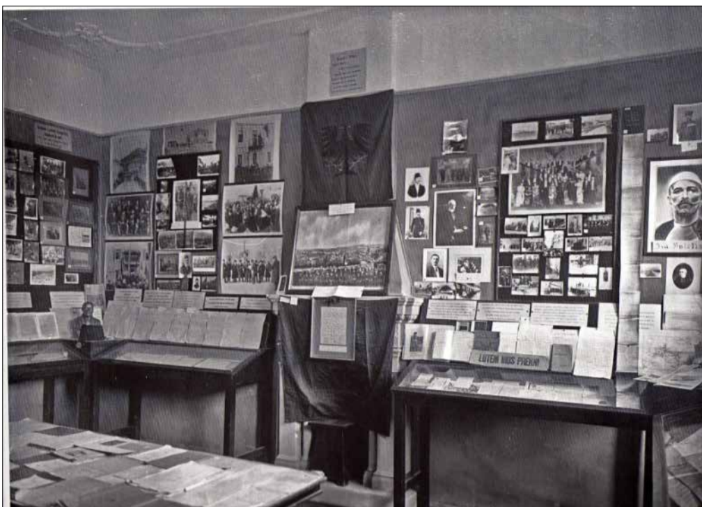
▲ Ekspozita e viti 1937, dhjetor 1937. Në qendër: Proçes-Verbali i dt. 28 nëntor 1912, me mungesa korumi etj... mbi një flamur; Foto e madhe austriake e realizuar me delegatët e Kongresit; Flamuri i Vidit; Libri i publikuar nga S. Gopçeviq, 1914, Flamuri I Vidit me yll të bardhë.