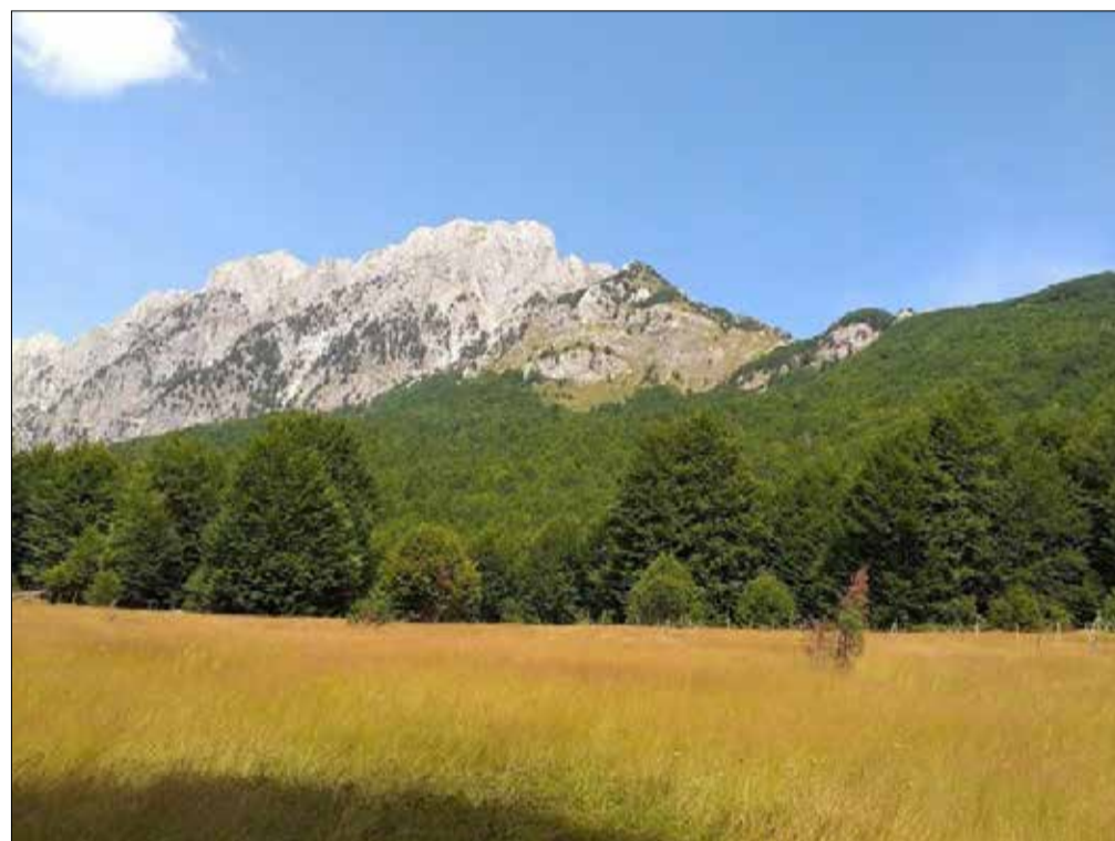
Kulla e Micit Bjeshka e Pevcajve