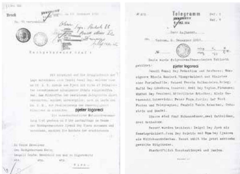
▲ Dy telegrame nga Vlora në Vjenë për kontin Bertold. Nxjerrë nga P. Logoreci.