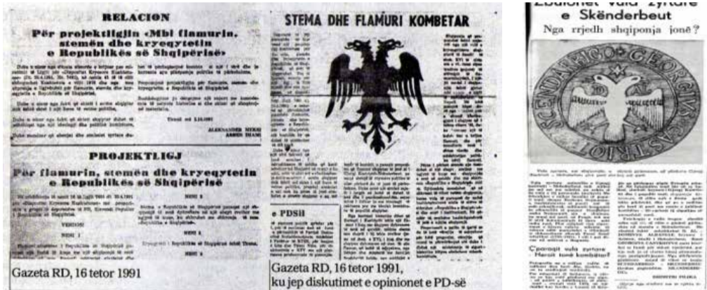
▲ Botimi te gazeta RD, 16 tetor 1991, me propoziminme Projekt Ligjin per ndrrimin e formë shqiptonjës dhe pastaj më 1998 ishte bërë psuhman e shadet!; botimi i shqiptonjës autentike të Vulës së Gj. Kastriotit, te gazeta Zëri i Popullit, 25 nëntor 1962. Kjo duhet të jetë formë shqiptonja originale e autentike e Flamurit dhe e Stemës së Republikës.