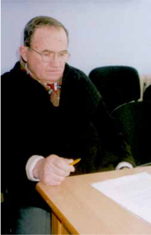
Përgatiti Luigi Temali

Kaluan vite nga Samiti i Tokës, në Johannesburg të Afrikës së Jugut, i organizuar nga Organizata e Kombeve të Bashkuara me pjesëmarrjen pothuajse të gjithë kryetarëve të shteteve të Botës. Konkluzioni: asnjë masë konkrete për të ndaluar erozionin e madh të klimës në planetit tonë.