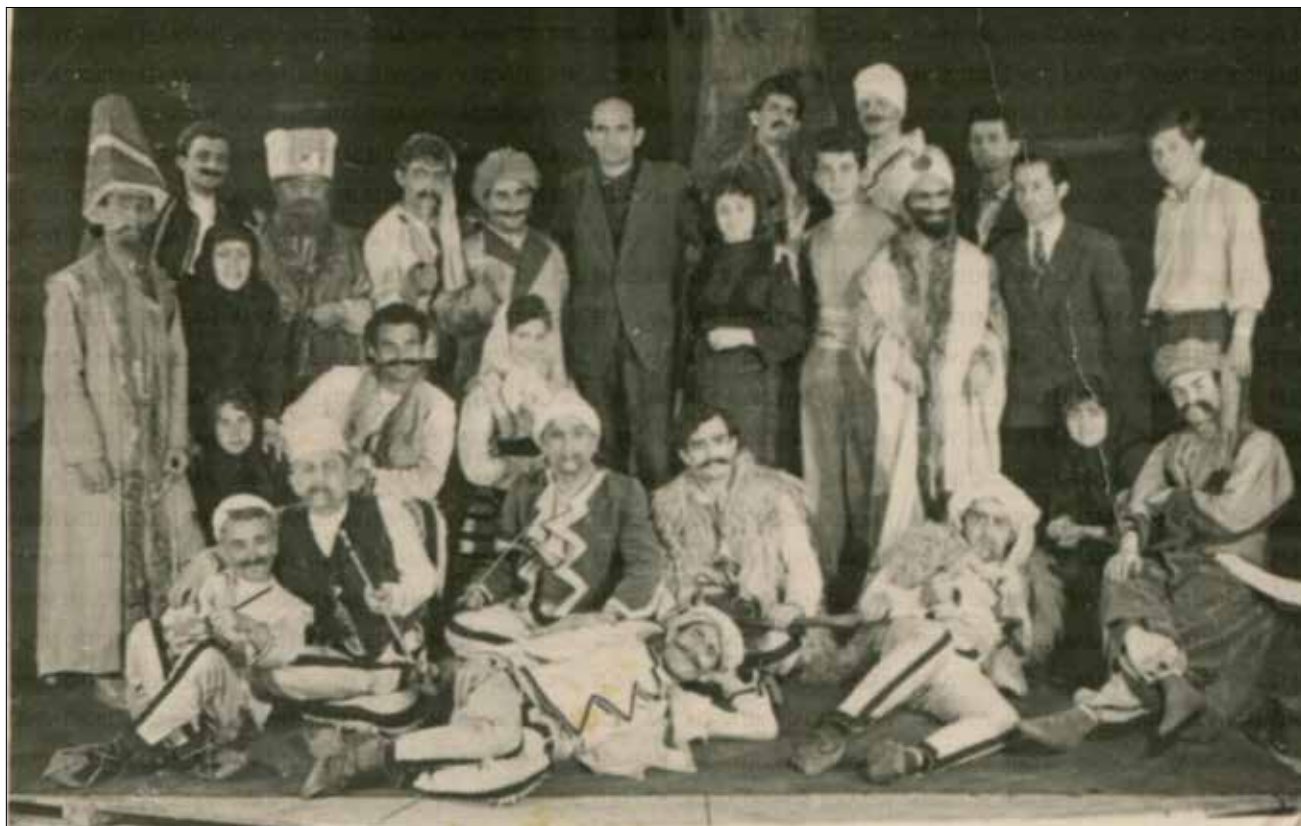
Moment nga shfaqja e dramës "Shtatë Shaljanët" nga trupa e Teatrit "Skampa" të Elbasanit

vitin 1816, që përkon më sundimin e Ibarhim Pashë Bushatit. Edhe po të ketë qenë, aspak nuk ja ulë vlerën asaj ngjarje.