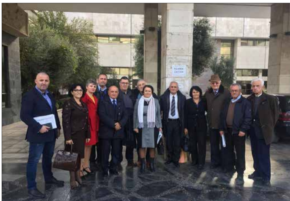
Anëtarët e shoqatës Atdhetare “Dukagjini”, të degës së Tiranës