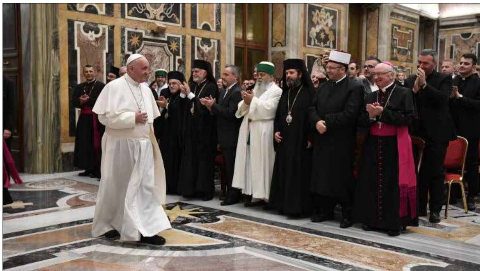
Papa Françesku dhe delegacioni shqiptar

me kënaqësi të veçantë, ju uroj mirëseardhjen juve, që keni ardhur këtu me rastin e 550-vjetorit të vdekjes së heroit tuaj kombëtar, Gjergj Kastriotit Skënderbeut. Përshëndes me mirënjohje të pranishmit dhe, me mendje, edhe gjithë shqiptarët, në atdhe e në vende të tjera të botës, të cilët, në emër të lidhjeve të lashta të miqësisë e të marrëdhënieve të vazhdueshme, e shohin gjithnjë me dashuri Selinë e Shën Pjetrit. Në këtë kuadër, më pëlqen të kujtoj se 50 vjet më parë, Shën Pali VI deshi të presë një përfaqësi të shqiptarëve.