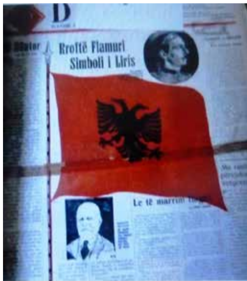
Gazeta “Drita” e 1936 dhe Buletini 16 nëntor 1944, me të njejtin stil e flamur, kapnin “Plakun e Vlorës”, si të dytin mbas tyre

Përgjigjet e dokumentuara nga Nunciatura Apostolike e Selisë së Shenjtë dhe nga Sekretaria e Shtetit të Vatikanit