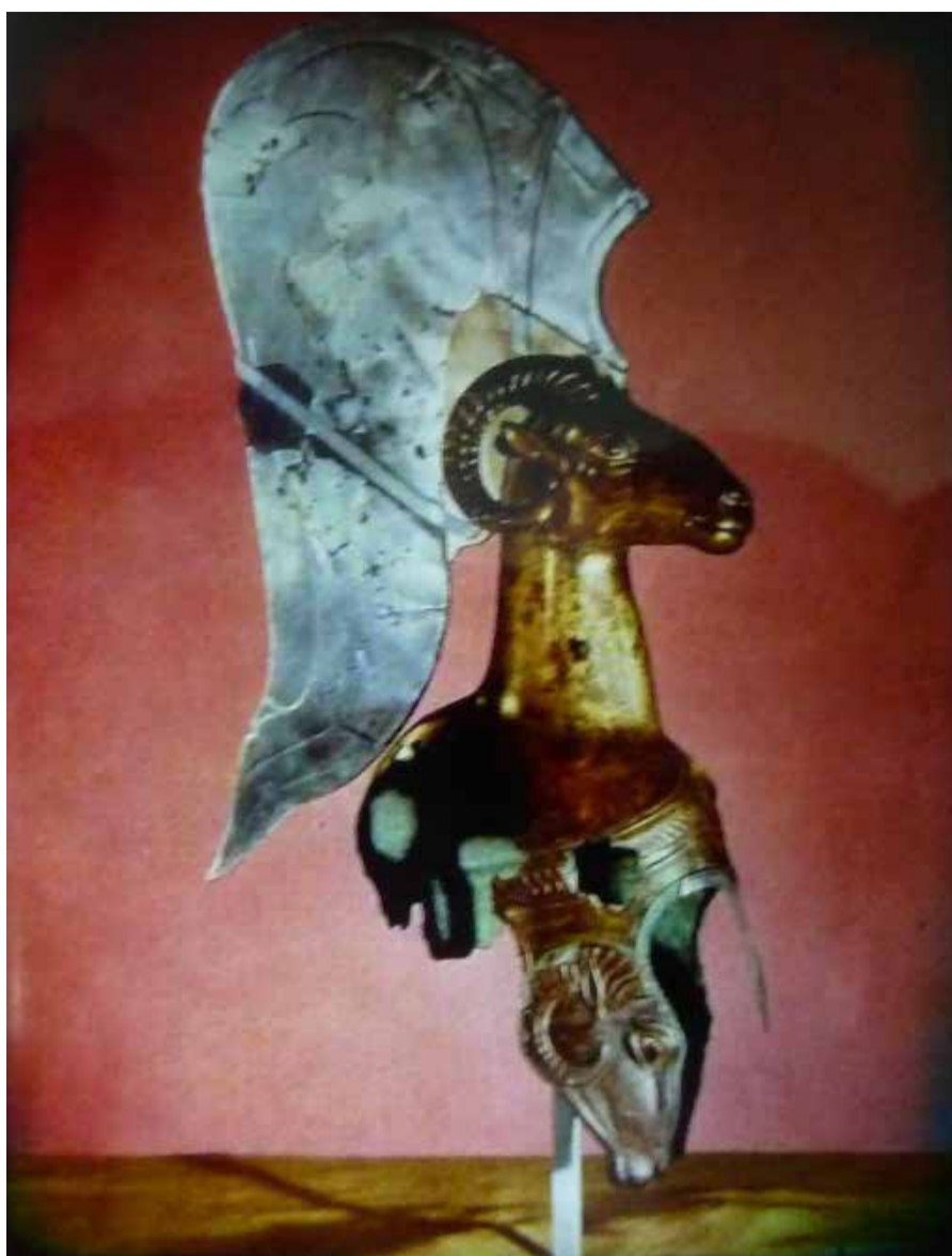
Helmetë / Përkrenare e mijvjeçarit I p. K. e gjetur nga zbulimet arkeologjike në Itali