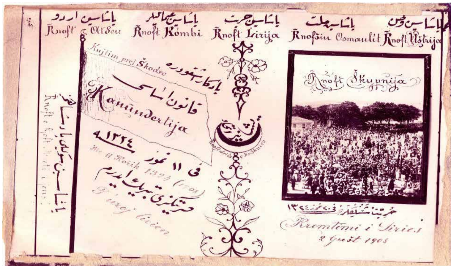
Shpallja e Kanunderlijës/Kushtetutës së Hyrrietit dhe festimet me parullat e Bashkimxhinjve Osmanllinj, në Shkodër, më 2 gusht 1908

Ky shkrim i prof. O. Myderrizit, një tjetër