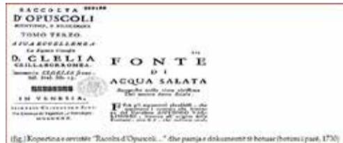
(Fig.1) Kopertina e revistës “Raccolta d’Opuscoli...” dhe pjesa e dokumentit të botuar (hermes i past, 1730)

Ky tekst, i panjohur deri më sot nga literatura dhe bibliografia shqipe, mban titullin: “Fonte di acqua salata, supposto nella cima altissima del monte detto Sciala” [“Burimi i ujit të kripur, i supozuar mbi majën më të lartë të malit të quajtur Shalë”]. Botimi i dytë këtij shkrimi ju bë tre vjet më pas, më 1733, në volumin e