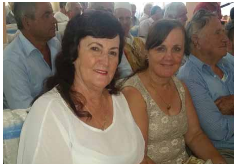
Pjesëmarrës në veprimtari