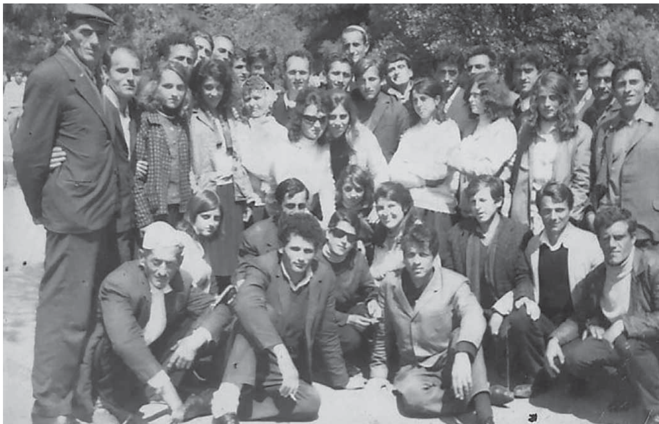
VEPRIMTARE DHE GRUPI ARTISTIK I SHTEPISE SE KULTURES BGREGLUMI - SHALE 1972

Nji gja vetem vijon te çudisi; se si ti, aq i ndryshem prej asaj njerëzie, flet te njajten gjuhë si ata.